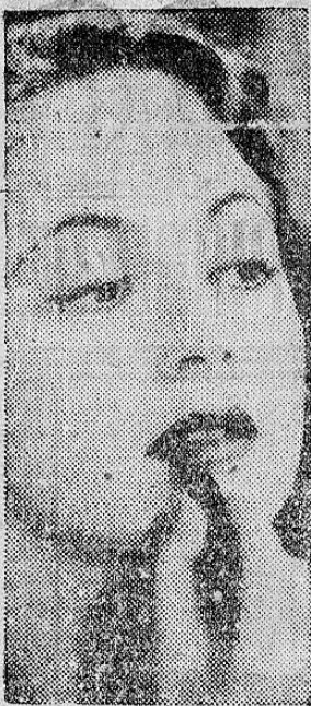
Clivia de Havilland Estrella de Warner Bros.